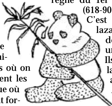
Dessins de Marc

Véritable fossile vivant, l'animal est déjà mentionné dans une chronique de l'an 621 sous le règne du 1 er empereur T'ang (618-906).